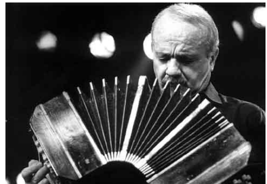
Ilustración 1: Fuente:

Después de una primera toma de contacto con los Six Etudes tanguistiques pour flûte seule , de Astor Piazzolla, me encontré con el contratiempo de que había muy poca información recopilada sobre ellos. Este fue uno de los motivos por los que me decanté a investigar sobre esta obra, con el fin de, entre otras muchas cosas, poder facilitar a los futuros interesados en el tema su recerca de información sobre la misma. En el presente artículo se destaca la figura de Astor Piazzolla en el mundo de la flauta travesera, así como los entresijos de los Six Etudes tanguistiques pour flûte seule . Todo esto relacionado con la vertiente interpretativa por la que también surge el trabajo sobre la obra.