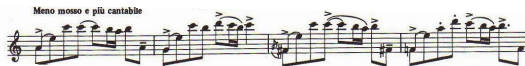
Ilustración 9: Estudio nº3, c.49-52