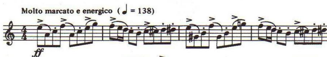
Ilustración 8: Estudio nº3, c.1-4