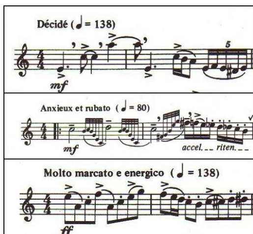
Ilustración 10: Primeros dos compases de los estudios 1, 2 y 3, respectivamente.